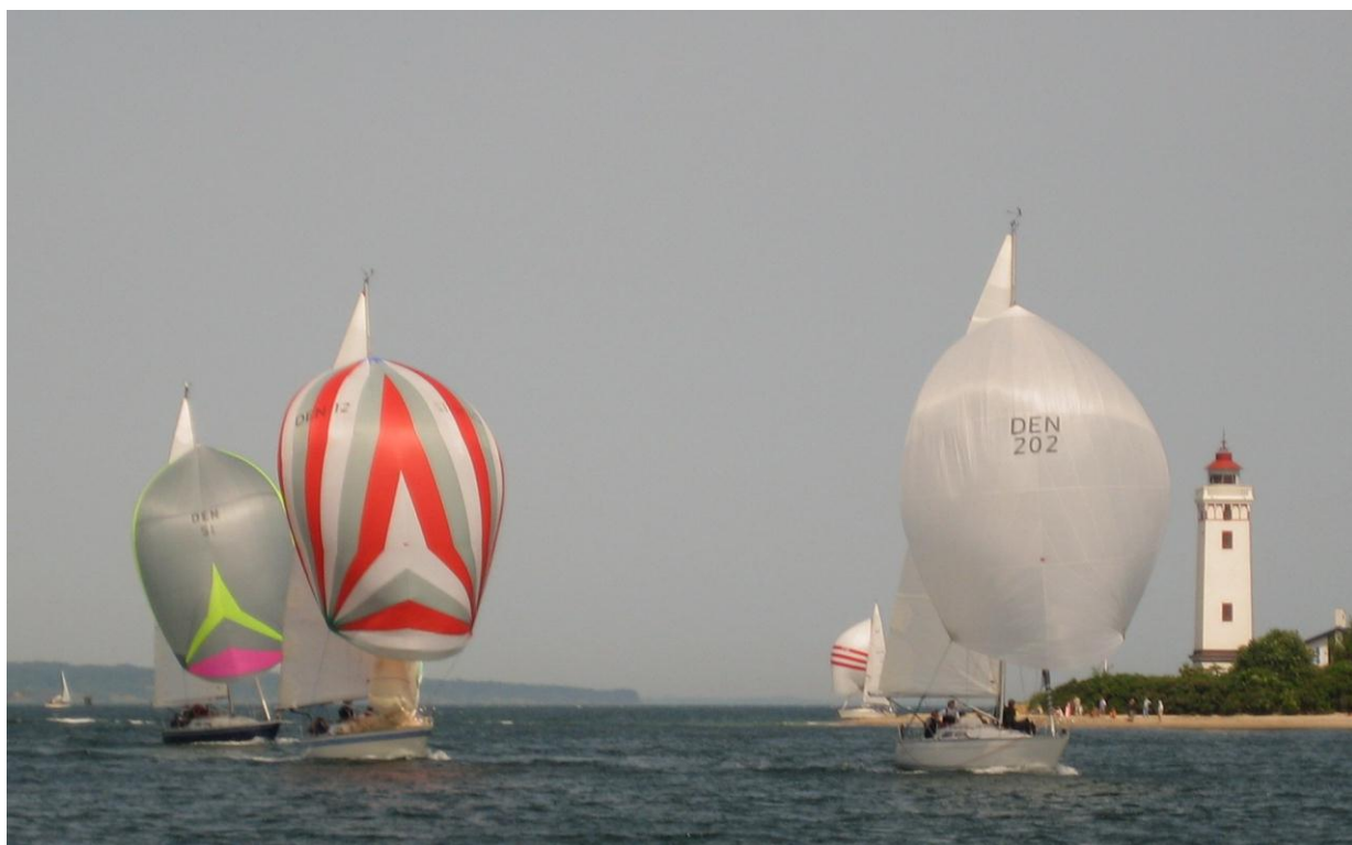
Luffesejlere ved Strib Fyr. Fyn Cup 2008.